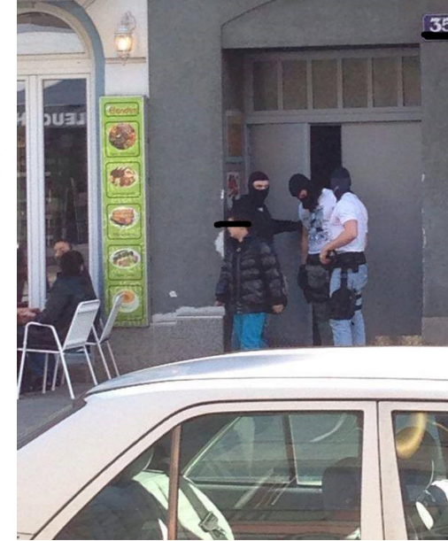
Operation Triest: Überblick der Verdächtigen

Türkei auch mit LKW über die Balkanroute geschickt - verpackt mitunter in neuwertig aussehenden Feuerlöschern. Die Ermittler gehen davon aus, dass Heroin und Kokain über den Seeweg ebenso nach Belgien und die Niederlande transportiert und von dort aus weiterverteilt wurde.