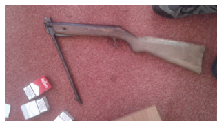
Sichergestellt: Heroin in Feuerlöschern (li.), Bargeld, Drogen, Handys und Schusswaffen